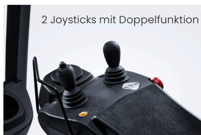
2 Joysticks mit Doppelfunktion