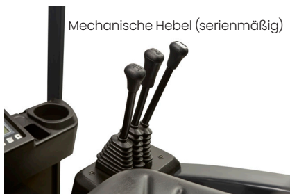
Mechanische Hebel (serienmäßig)

Der Fahrer kann zwischen drei verschiedenen Hydraulik-Bedieneinheiten wählen, um Lasten möglichst mühelos und schnell zu manövrieren. Der CESAB B200 ist serienmäßig mit seitlich vom Sitz angebrachten mechanischen Hebeln ausgestattet. Optional sind Mini-Hebel zur Tippsteuerung oder zwei Joysticks mit Doppelfunktion auf einer umfassend verstellbaren Armlehne erhältlich.