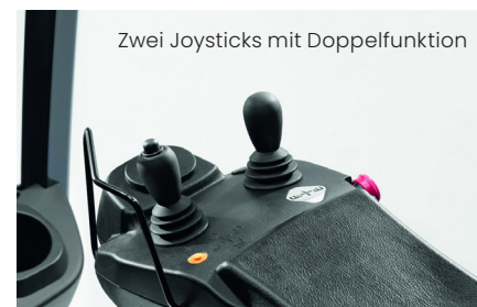
Zwei Joysticks mit Doppelfunktion