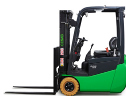
B213 1,25t @ LC 500