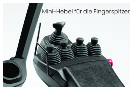
Mini-Hebel für die Fingerspitzen